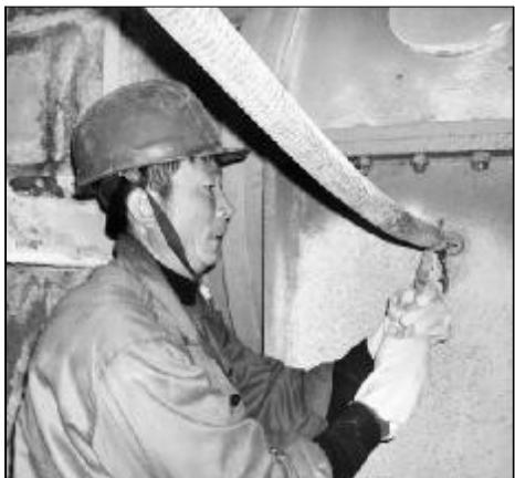
为确保保原料磨系统稳定运行,近日,万吨氧化铝厂二车间对原料磨磨磨大瓦进行循环清洗,彻底消除大瓦结疤,使磨磨大瓦运行顺畅,保证设备长期高效稳定运行。图为检修人员正在紧固酸洗软管。

通过扎实开展活动,电修车间营造了人、机、环境和谐安全的良好氛围,提高了员工安全防范意识,促使员工养成遵守规章的良好习惯。(孙海燕)