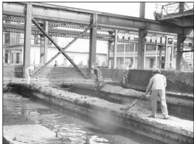
4月7日、8日,煤气分厂供排水车间利用煤气生产用水量减少、循环水位降低的时机,组织倒班职工对整管循环水渠淤泥进行彻底清理,保证水渠畅通,为生产运行做好充分准备。因为员工们正在清理水渠淤泥。

在国际金融危机对铝公司和山西分公司带来严重冲击,企业上下打响控亏增盈攻坚战的关键时刻,素有“设备卫士”之称的检修分厂将服务好氧化铝生产作为中心工作,结合自身实际情况,制定了一系列控亏增盈具体措施,用实际行动开展了挖潜增效、控亏增盈。