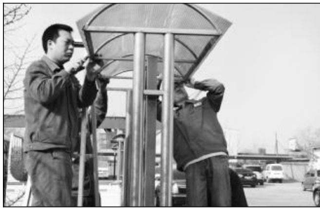
近日，西旺物业部团员充分发挥聪明才智，自带工具对部内四个宣传栏进行了修理，节省开支近千元，为打好控亏增盈攻坚战做出贡献。

公司要求各单位按照“谁主管、谁负责”的原则，建立健全社会治安综合治理组织机构及网络，做到“三个加强”，即加强内部治安防范，加强“五管”及“要害部位”管理，加强对“法轮功”分子的教育转化；做好“一个深入”，即深入开展矛盾纠纷排查，认真落实各项防范措施，切实做好社会治安综合治理工作，为公司科学和谐发展保驾护航。（实宣）