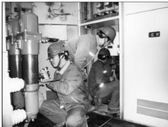
连日来,在广大参战电气人员的协同作业下,氧化铝一分厂电气春检工作有序推进。图为BD7 II段春检现场,电气作业人员正在按春检作业程序对电气隐患进行消除。

此外,在春检过程中还要求做到四个明确:根据生产现场实际情况,明确安全交底,明确工作负责人,明确现场监护人,明确工作质量检查人。作业后做好技术总