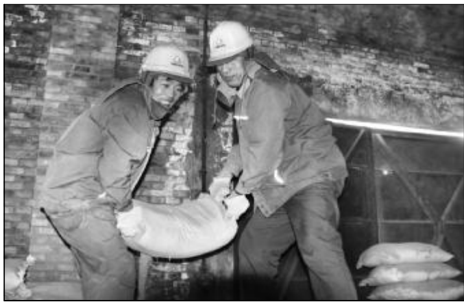
▲2月20日,氧化铝二分厂机关支部11名党员主动请缨,承担三车间1号窑冷却机检修用耐火材料的搬运任务。经过2个多小时的奋战,搬运耐火材料18吨,为1号窑冷却机按期投入运行赢得了时间。图为机关党员正在奋力搬运耐火材料。

夜晚23时,就在陈大爷家人束手无策时,接到了一个好心人的电话,说厂区内有一位老人和寻人启示里描述的很相像。就这样,按照好心人提供的信息,陈大爷家人在氧化铝厂区找到了已经冻得麻木的陈老汉。经医院检查,陈大爷除身体部分略有冻伤外,其他一切正常。当时,由于陈大爷家人都在焦急的等待老人的消息,忘记寻问打电话人的姓名和工作单位。在多方打听未果后,陈大爷家人借《劲旅》报发出寻找好心人启示,有知情者请与13935948201陈先生联系,陈大爷家人想对好心人的热心相助表示衷心的感谢。(尹峰)