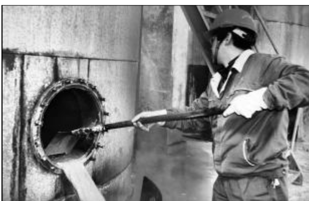
近日,80万吨氧化铝厂四车间组织人员对过滤器、沉降槽、滤饼槽、溢流泵等封存设备检查消缺,以确保排盐系统的顺利投用。图为员工对滤饼槽进行清理。