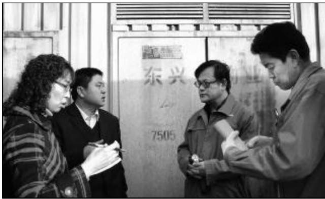
为适应公司制改革需要,完成收费目标任务,2月13日,东兴物业部组成检查组对辖区内的水、电表进行摸底排查,对未安装表计的各单位、个体经营户进行表计完善。图为检查人员正对表计进行核实登记。

★ 2月13日,氧化铝三分厂八车间针对碳碱含量过高导致系统带料的状况,实施了增加一根返洗液管的措施,以最大限度减少碳碱结晶,优化各项技术指标。(孟青菊)