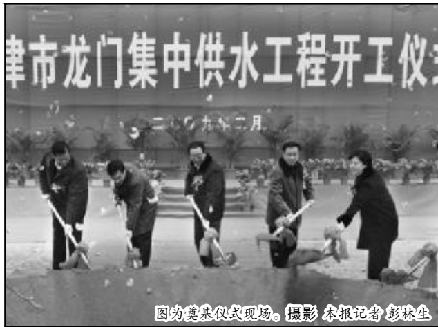
图为奠基仪式现场。

参加仪式的还有受益乡镇的干部、水利系统全体职工、工程建设单位和监理单位共计500余人。