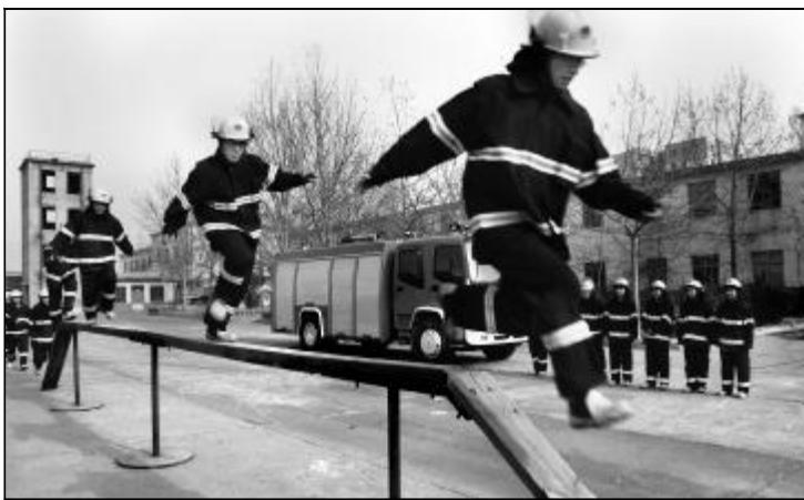
为确保2009年春节消防安全万无一失,离门分局消防大队高度重视,提前介入,严密部署,努力使广大群众度过一个安全、欢乐、祥和的新年。图为消防人员正在紧张训练。摄影报道 本报记者 彭林生

山重水复疑无路,柳暗花明又一村。经历年初冰雪灾害,年中限电,年末金融危机的山西铝厂,强化内部管理,深入挖潜增效,实现了生产经营逆势而上,平稳增长,彰显了实施走出去战略、发展多元化产业政策的优越性,夺取了企业发展的新胜利。