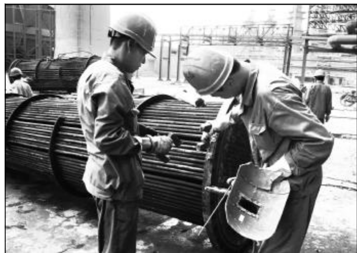
近日,8万吨氧化铝厂二车间开展了放射源清查活动,对辖区内使用放射源的设备进行清查,查看设备操作记录、标志、安全防护设备等,切实做好放射源安全防护措施。图为车间管理人员正在检查放射源安全防护措施。

查。二是量化安全管理责任。各车间根据18个子项内容确定责任人,车间对各责任人每周的具体工作情况进行检查;各责任人对查出的事故隐患要向车间领导提出整改意见,车间领导对每项隐患做出具体安排,并做到“三落实”,即:落实责任人、落实完成时间、落实整改要求,并逐项填写在“处置情况”一栏;分厂安全环保科对各单位周检查工作情况进行督办,并在月底提出考核意见。(陈文郁)