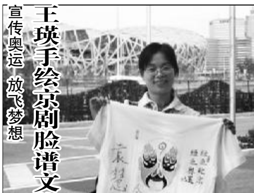
宣传奥运 放飞梦想