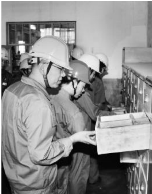
8月12日,80万吨氧化铝厂组织分厂、车间管理人员观摩学习检修分厂机制车间的现场安全环境卫生、物品放置等6S管理,为规范车间工作秩序、改善工作环境、提高工作效率、推进6S管理各项条例的完善起到积极作用。图为参观人员正在学习物品抽屉式管理模式。

一是党支部的组织作用充分显现。在活动中各党支部充分发挥组织优势,制定详细的学习推进计划,明确学习内容和目标,有力地带动了员工自觉学习理论和专业知识的积极性、主动性,在学习上更注重学习效果,充分体现出党支部的组织作用。二是党员主动学习的意识明显增强。在党支部的正确引导和严格考核下,多数党员已认识到学习是自身进步、促进工作、提高业务的现实需要,逐渐克服了以前思想上的误区,现在党员在工作中行动更加积极,态度更为主动。三是有力地促进了工作。在节能降耗中,通过学习专业技能科学合理组织生产,压停一台管泵,每天节电在2万度以上。同时利用浴池水及软化水的反冲洗水,作为生产水的补充水,每月可节约新水2000吨左右。(金海波)